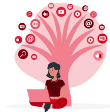
Illustration by Freepik - Storms